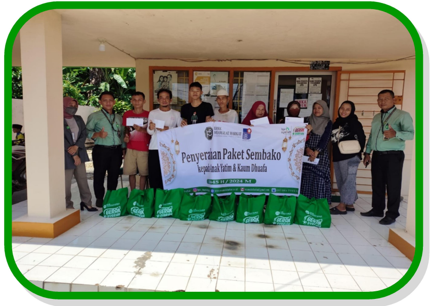
Kegiatan Penyerahan Paket Sembako kepada kaum dhuafa di lingkungan Kantor Kas Manna PT. BPRS Muamalat Harkat.