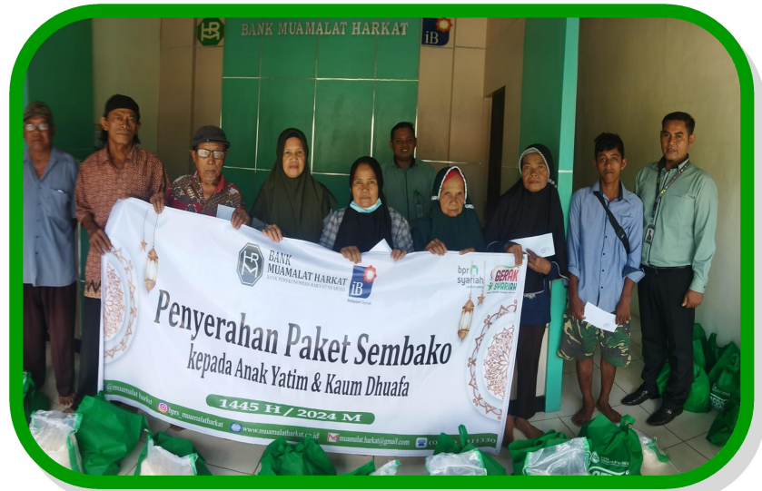
Kegiatan Penyerahan Paket Sembako kepada kaum dhuafa di lingkungan Kantor Kas Ketahun PT. BPRS Muamalat Harkat.