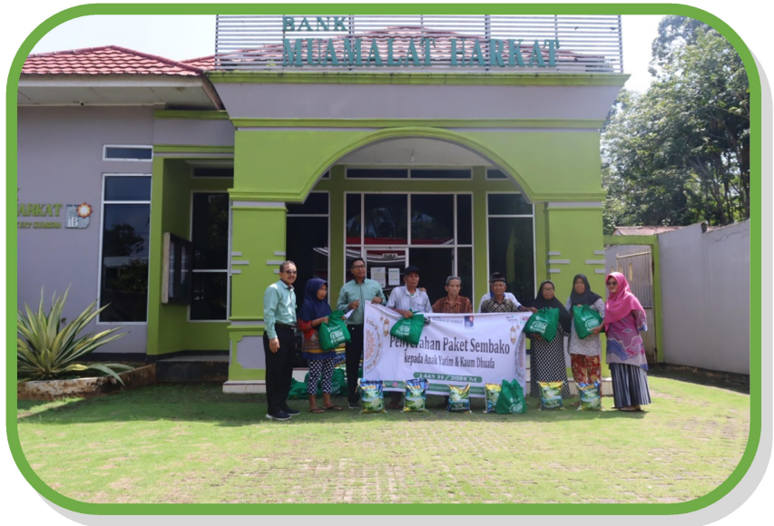
Kegiatan Penyerahan Paket Sembako kepada kaum dhuafa di lingkungan Kantor Pusat PT. BPRS Muamalat Harkat.